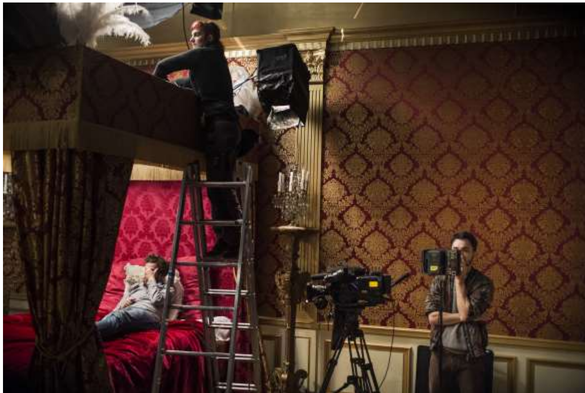
La mort de Louis XIV, 2015.

> Intégralement préservé, le décor de la chambre de Louis XIV est ouvert à la visite durant la saison 2020.