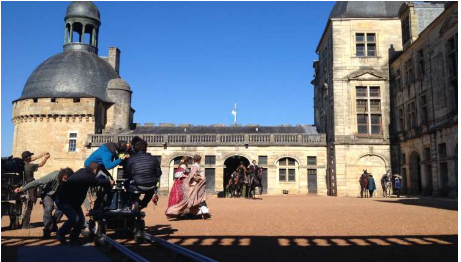
Richelieu, 2013. © Xavier Fabre

VISITE D'UN DÉCOR ET PLATEAU DE CINÉMA EXPOSITION « 50 ANS DE CINÉMA À HAUTEFORT » Du 1 er avril au 31 octobre 2020 – Château de Hautefort, Dordogne