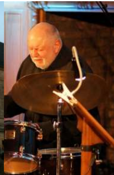
Animations au château de Hautefort.