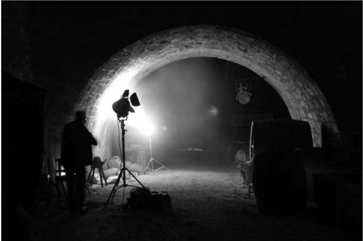
Cartouche, 2009.

> Deux séances de cinéma en plein air avec Ciné Passion en Périgord, sont projetées dans la cour d'honneur du château en juillet et en août.