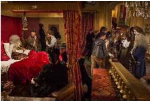
© Rodolphe Escher La mort de Louis XIV, 2015

Les photos seront fournies sur simple demande en haute définition. Mention du Copyright obligatoire.