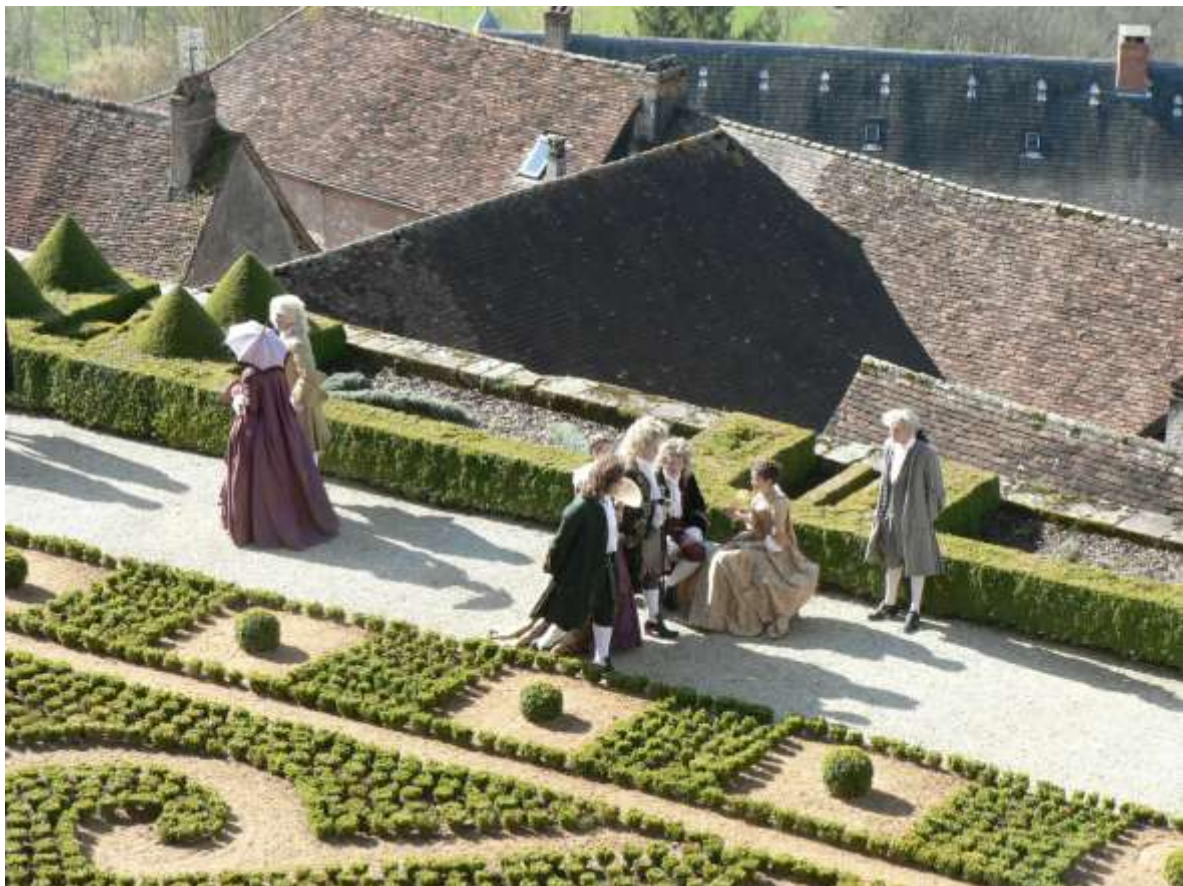
Cartouche, 2009.

D'une manière générale, le cinéma est un levier de développement économique et touristique aussi bien pour le lieu de tournage que pour la région qui accueille la fiction.